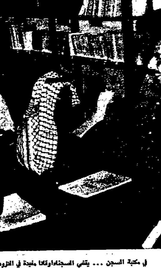
في مكتبة السجن ... يقضي السجناء وقتا مفيدا في التردد بالعلم والمعرفة

اجدان .. اقتصيا قبل سنوات اريمة واكتشفت الجريمة .. حسب الجاني .. ودخلت الام السجن موقوفة لمدة شهرين .. وكذا التصديق المخرج ان لها نظري القتل! وولد طفلها في السجن وما يزال رقم انه الآن في الرابية من عمره .. «ك» «ال» الضربة الكورية .. معها طفلان .. كان زوجها يرهبها على طعمها العذرة كما في اللان .. دخلت السجن .. ودخلت معها طفلها .. و«ل» .. ولدت طفل الخاطئة في السجن .. ويبدو مسفرة .. زوجها من كهل، عنيا توجهت الى السجن .. كت نورت مع شاب .. وكجبان تطفى منها